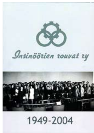
Insinöörien Rouvat ry:n historiikin kansikuvassa rouvat ovat vierailulla Edunkuntatalossa vuonna 1968.

■ Insinöörien Rouvat ry:n syntyvuosi oli 1949. Alkuaikojen ja tapahtumien 55 vuoden ajalta muistellaan rouvien tuoreessa historiikissa. Kansien väliin on tiivistetty keskeiset asiat kultakin vuosikymmeneltä ja runsaasti kuva-ainestoa. Teoksesta välittykin heti selaillemalla kuva yhdistyksen vilkkaasta toiminnasta ja rouvien iloisesta yhdessäolosta. □