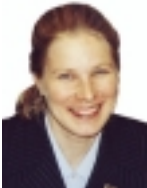
Marjo Matikainen-Kallström DI, Euroopan Parlamentin jäsen Kokoomus 10807 ääntä